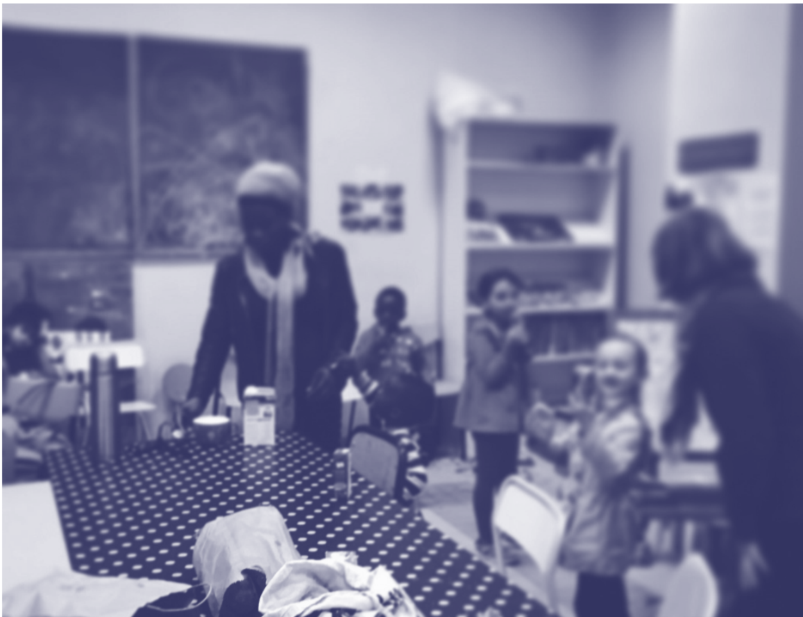
Petit-déjeuner au Lieu Accueil Parents de l'école Michel Servet (Lyon 1 er ) novembre 2019