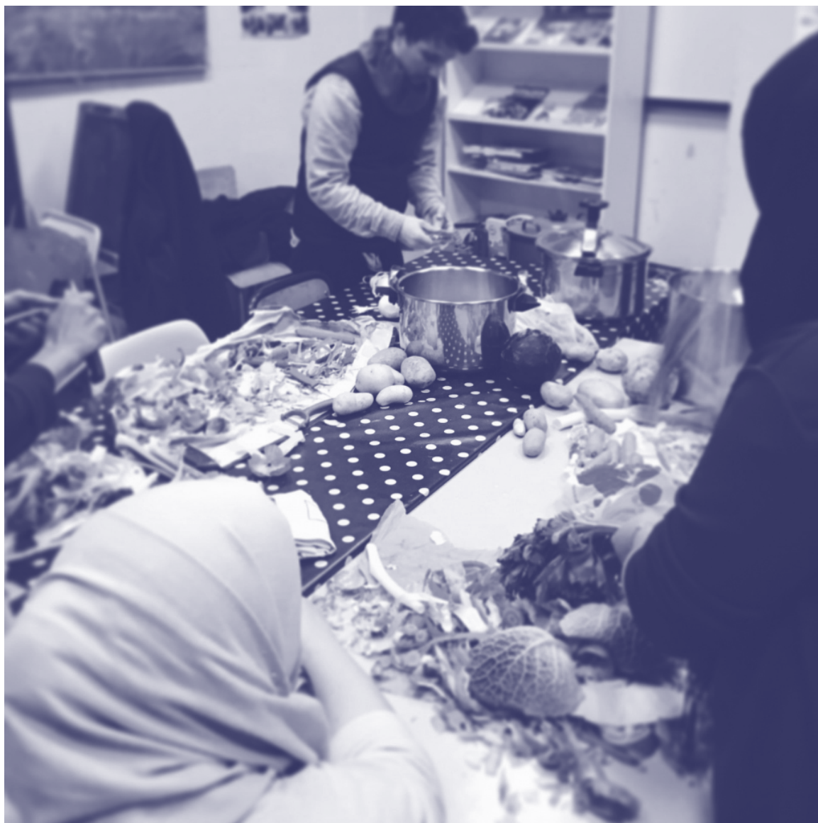
Préparation de la soupe des Lumières le 6 décembre 2019 au Lieu Accueil Parents de l'école Michel Servet à Lyon

→ Proposer aux associations locales de participer à la première réunion.