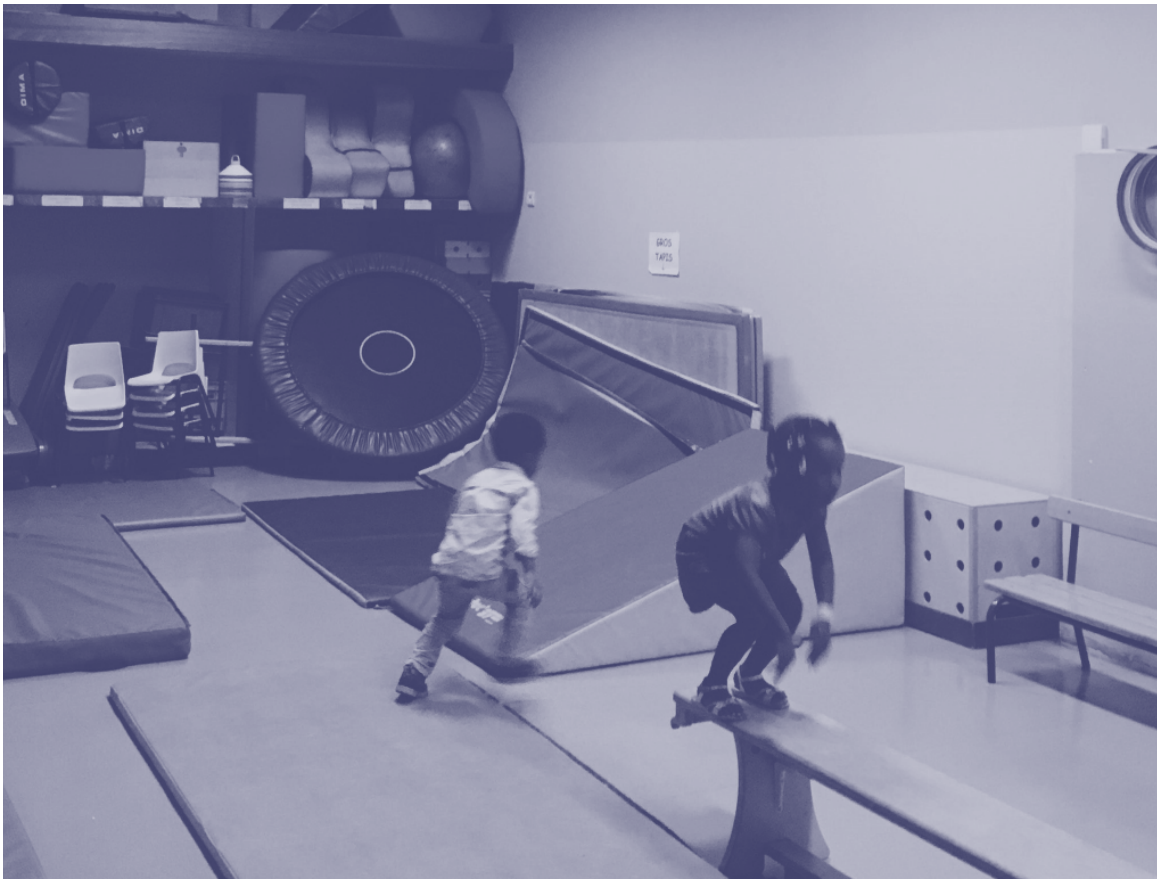
Occupation du gymnase de l'école Michel Servet (Lyon 1 er ) novembre 2019