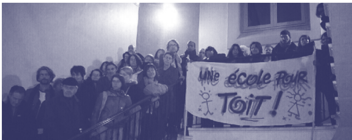
Occupation de l'école Gilbert Dru (Lyon 7 e ) le 7 novembre 2016